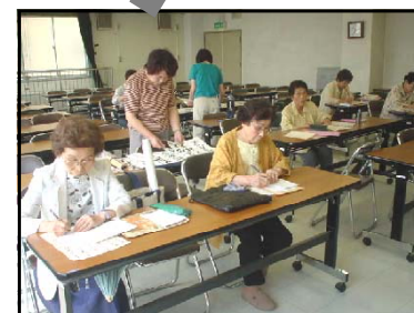
おうこうこうみんかん 大河公民館 様々な講座やもよおしがあり、地域の人々の生涯学習の場となっています。