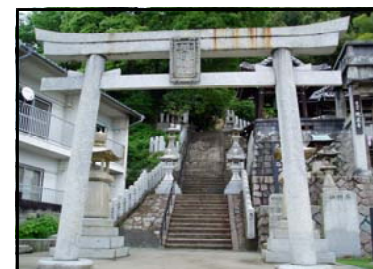
おうばんじんじや 黄幡神社 正式には真幡神社といい、地域の人々から親しまれています。原爆の惨禍を後世に伝える神社です。