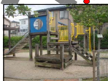
あさひだいいちこうえん 旭第一公園 「ちびっこ広場」とよばれ、子どもたちから親しまれています。