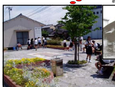
ぼぽぼ広場 旧国鉄宇品線大河駅があった場所です。1966年までの35年間にわたり、多くの人々に利用され、地域の中心としてにぎわいました。