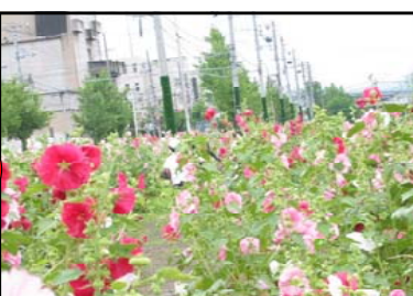
あおい通り 白、ピンク、むらさきなどのタチアオイの花が1kmにわたって続いています。