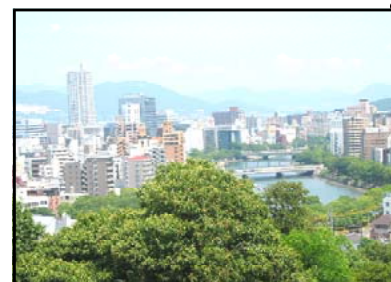
ひじやま 比治山から見た広島市の風景 比治山公園の展望台からは、市内が一望できます。