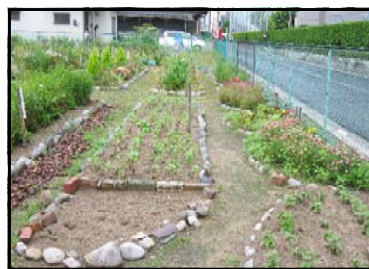
かすみ 霞フラワーガーデン 広島市の市有地を利用して花畑が作られています。美しい大河の町は人々のやさしい心でつくられています。