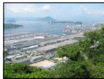
おうごんざん 黄金山から見た瀬戸内海の風景 自然に恵まれ、たくさんの動植物が生息します。春には桜の花で山がピンクにそまります。