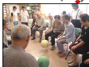
こうせいえん 光清苑 特別養護老人ホームのほか、デイサービスもおこなわれています。