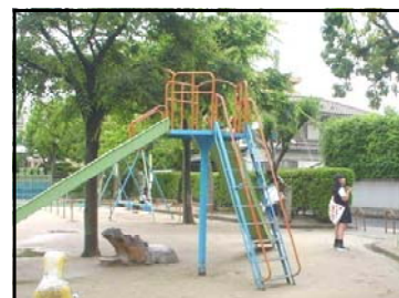
にしからみちようこうえん 西霞町公園 大河小学校から最も近い公園。自主的に清掃活動がおこなわれ、地域の人々から愛されている公園です。