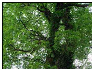
おうばんじんじや 黄幡神社のクスノキ 平成14年に広島市保存樹に指定されました。高さは22.5mあります。