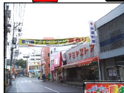
あさひまちしょうてんがい 旭町商店街 「人と人とのつながりを大切に」という願いから「アイビータウン」と名づけられました。7月には夏祭りがおこなわれ、子供たちが楽しみにしています。