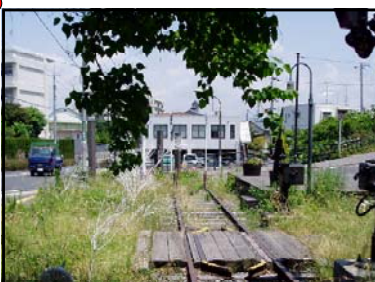
きゅうこくつうじなせん 旧国鉄宇品線のきりかえポイント 広島駅と宇品港を結んでいた宇品線のきりかえポイントが、現在も残されています。