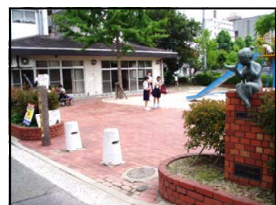
でしおだいいちこうえん 出汐第一公園 旧国鉄宇品線大河駅があった場所です。