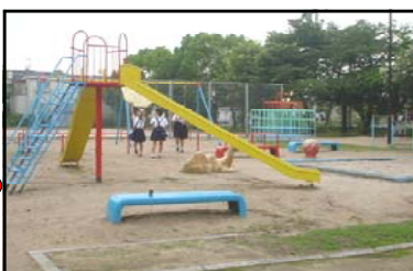
やましろこうえん 山城公園 広い運動場があり、遊具も豊富です。子供からお年寄りまでの憩いの場となっています。