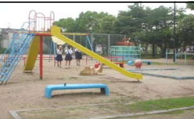
やましろうえん 山城公園 広い運動場があり、遊具も豊富です。子供からお年寄りまでの憩いの場となっています。