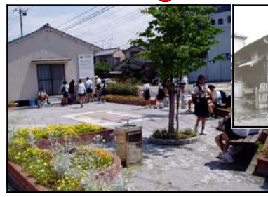
ぼぼ広場 旧国鉄宇品線大河駅があった場所です。1966年までの35年間にわたり、多くの人々に利用され、地域の中心としてにぎわいました。