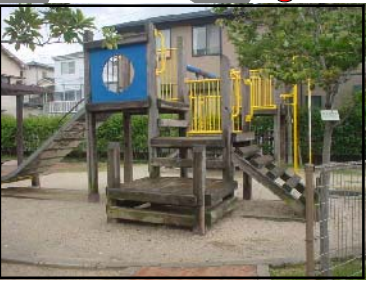
あさひだいちこうえん 旭第一公園 「ちびっこ広場」とよばれ、子どもたちから親しまれています。