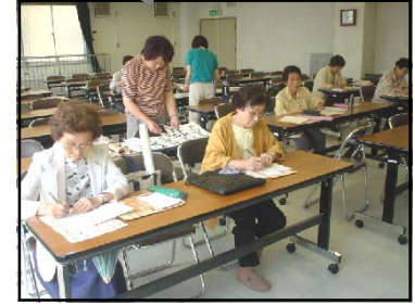
おうこうこうみんかん 大河公民館 様々な講座やもよおしがあり、地域の人々の生涯学習の場となっています。