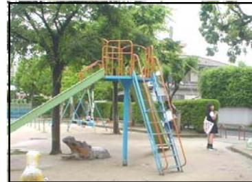
にしかすみちようこうえん 西霞町公園 大河小学校から最も近い公園。自主的に清掃活動がおこなわれ、地域の人々から愛されている公園です。