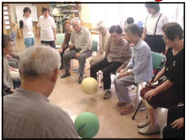
こうせいえん 光清苑 特別養護老人ホームのほか、デイサービスもおこなわれています。