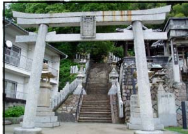
おうほんじんじや 黄幡神社 正式には真幡神社といい、地域の人々から親しまれています。原爆の惨禍を後世に伝える神社です。