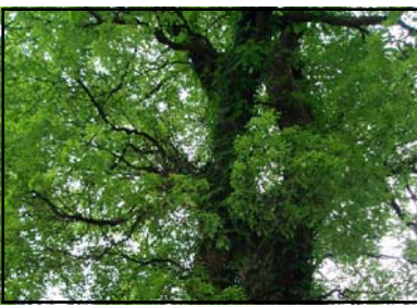
おうほんじんじや 黄幡神社のクスノキ 平成14年に広島市保存樹に指定されました。高さは22.5mあります。