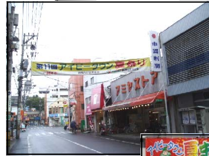
あさひまちしょうてんがい 旭町商店街 「人と人とのつながりを大切に」という願いから「アイビータウン」と名づけられました。7月には夏祭りがおこなわれ、子供たちが楽しみにしています。