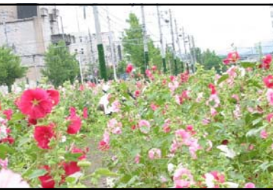
あおい通り 白、ピンク、むらさきなどのタチアオイの花が1kmにわたって続いています。