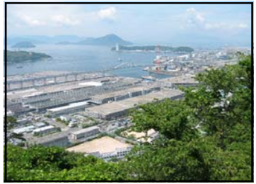
おうごんざん 黄金山から見た瀬戸内海の風景 自然に恵まれ、たくさんの動植物が生息します。春には桜の花で山がピンクにそまります。