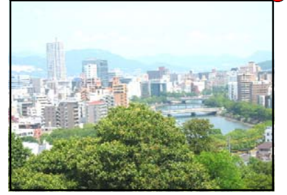
ひじやま 比治山から見た広島市の風景 比治山公園の展望台からは、市内が一望できます。