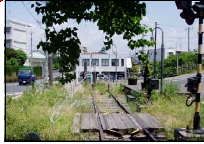
きゅうこくてつうじなせん 旧国鉄宇品線のきりかえポイント 広島駅と宇品港を結んでいた宇品線のきりかえポイントが、現在も残されています。