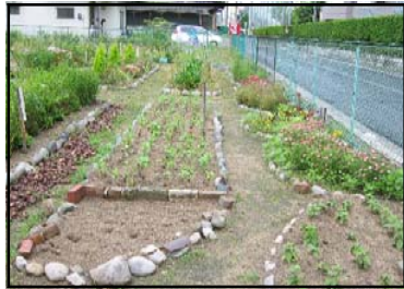
かすみ 霞フラワーガーデン 広島市の市有地を利用して花畑が作られています。美しい大河の町は人々のやさしい心でつくられています。