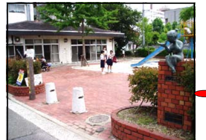
でしおだいちこうえん 出汐第一公園 旧国鉄宇品線大河駅があった場所です。